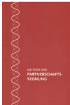
Seit 2014 in Gebrauch: Der von der Liturgischen Kommission des Bistums erarbeitete Ritus für die Feier der Partnerschafts- segnung

Nun versuchen wir es wieder, diesmal mit einem spannenden Thema, das sehr breit formuliert ist: Partnerschaft – Ehe – Sakrament. Seit der 59. Synode 2014 gibt es in unserem Bistum einen Gesprächsprozess zu diesem Themenbereich. Hintergrund ist ein Antrag an die 59. Synode, der darauf hinausläuft, die Segnung gleichgeschlechtlicher Paare mit der Ehe gleichzustellen. Gesellschaftlich wird dies bereits seit langem getan. Anders ist das im kirchlichen Bereich: Da besteht schon in der Grundfrage, ob die Partnerschaft gleichgeschlechtlicher Paare gesegnet werden darf, ein Dissens. Einer Gleichstellung solcher Partnerschaften mit der Ehe stehen, so wird vielfach argumentiert, auf der einen Seite schöpfungstheologische Gegebenheiten entgegen, vor allem die Zeugung von Nachkommenschaft, auf der anderen Seite aber auch die Sakramentalität der Ehe nach katholischem Verständnis. Im Alt-Katholischen Seminar der Universität Bonn wird diesbezüglich deshalb seit 2015 nach theologisch vertretbaren Lösungen gesucht, die eine Gleichstellung von Ehe und gleichgeschlechtlichen Partnerschaften auch auf kirchlichem Sektor ermöglichen. Beim Kaffee-Talk am Sonntag, 7. Mai, im Anschluss an die Eucharistiefeyer , die wie immer um 10:00 Uhr beginnt, sollen die bisher vorliegenden Forschungsergebnisse vorgestellt und diskutiert werden.