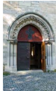
Die geöffnete Kirchentür: Seit 20 Jahren Symbol für die Einladung zu Kathy's Vesper.