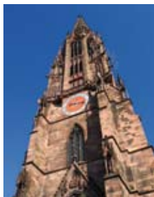
Wahrzeichen der Schwarzwaldmetropole: Das Freiburger Münster

Am Samstag, 17. März 2018, wird in Freiburg im Breisgau die nächste Landessynode der Alt-Katholischen Kirche in Baden-Württemberg stattfinden. Laut Ordnung kann unsere Gemeinde aufgrund ihrer Mitgliederzahl vier Abgeordnete für die Landessynode wählen. Bisher sind zur Kandidatur bereit: Klaus Juchart und Dieter Schütz. Weitere Vorschläge können bis zum 10. September beim Pfarramt eingereicht werden. Sie müssen von mindestens zwei wahlberechtigten Gemeindemitgliedern unterzeichnet sein