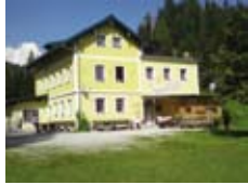
Das Mitterberghaus in Mühlbach a.H.