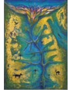
»Wasserstrme in der Wste«. Motiv des Weltgebetstags 2014