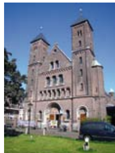
Kathedrale des alt-katholischen Bistums Utrecht

So 03. – Sa 9.08.2014 Mühlbach am Hochkönig Österreich