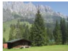
Hochkönigmassiv in Mühlbach

Der Familienkreis lädt alle Familien der Gemeinde zu einem Familienwochenende ein, das vom 11. bis 13. Juli in Michelrieth stattfindet (nähere Infos unter www.jugendhaus-michelrieth.de ). Wir wollen gemeinsam Spaß haben, uns gegenseitig besser kennenlernen und gemeinsam Gottesdienst feiern. Wer mitfahren will, kann das per E-Mail an familienkreis@alt-katholisch-stuttgart.de tun oder durch Anruf im Pfarramt.