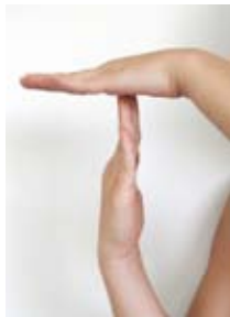
Deutsche Gebärdensprache.

Das Wohnstift Mönchfeld besteht aus mehreren Gebäuden, die sich um einen Innenhof mit Gartenteich gruppieren. In der gemütlichen