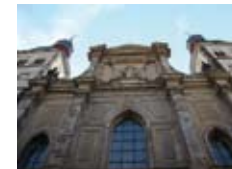
Namen-Jesu-Kirche in Bonn

Auch das gehört zur Fastenzeit und bezieht sich traditionell auf die Taufen an Ostern: Dass der Bischof im Rahmen einer besonderen Eucharistiefeier, der »Chrisammesse«, die Öle weicht, die dann bei Taufvorbereitungen, Taufen, Firmungen, Priesterweihen, eventuell auch Kirchweihen sowie bei der Feier des Sakraments der Stärkung verwendet werden. Der Gottesdienst, der immer am Mittwoch nach dem Aschermittwoch stattfindet, lebt davon, dass aus den Dekanaten und Gemeinden des Bistums »Ölboten« kommen, um die Öle mit nach Hause in die Gemeinden zu nehmen. In unserem Bistum ist die Chrisammesse mit einem Einkehrtag der Pfarrerrinnen und Pfarrer verbunden. Termin der Chrisammesse ist der 12. März um 18:00 Uhr in der Namen-Jesu-Kirche in Bonn.