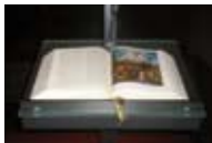
Ambo der Kirche St. Katharina, Stuttgart

Schon an den vier Adventssonntagen haben solche Predigten stattgefunden; sie können auf der Homepage unserer Gemeinde nachgelesen werden. Möglichkeiten zum Austausch und zur Vertiefung bieten sich beim Kirchenkaffee nach den Gottesdiensten und beim Jour fixe der Gemeinde – siehe dazu auch auf Seite 6.