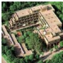
Wohnstift Mönchfeld Susanne-Urban-Haus