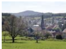
Blick auf die Gemeinde Nieder-Liebersbach

Die folgenden Termine wollen geplant werden, weil es sich um größere Projekte handelt.