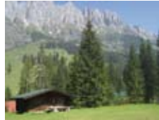
Hochkönigmassiv: Blick aus dem Mitterberghaus, in dem wir seit 2000 zu Gast sind.