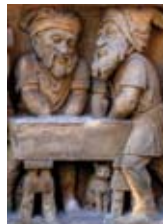
Bilder o. und u.: Details aus dem Heinkelmannchen- brunnen in Köln

Für die erwachsenen Firmbewerberinnen und Firmbewerber gibt es natürlich eine eigene Vorbereitung, die vor allem bei geistlichen Einkehrtagen stattfindet.