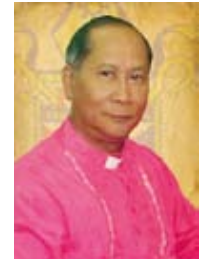
Ephraim S. Fajutagana, aus Manila / Philippinen, ist leitender Bischof der Iglesia Filipina Independiente (IFI).

Abend der Begegnung Mi 03.06.2015, Stuttgart, Theodor-Heuss-Straße ab 19:00 Uhr