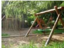
Spielplatz gegenüber dem Gasthof Sonne

geht es zu einem geeigneten Platz, auf dem wir Eucharistie feiern können. Für 13:30 Uhr sind im Gasthof »Sonne« Plätze reserviert. Der Gasthof gilt mit dem gegenüberliegenden Spielplatz als familienfreundlich. Wer Lust auf eine Klosterführung hat, kann diese um 15:00 Uhr anschließen. Die Rückfahrt ist für 16:26 Uhr geplant – zunächst mit dem Bus bis Echterdingen und dann mit der S2 weiter nach Stuttgart/Hauptbahnhof. Ankunft dort ist um 17:35 Uhr. Aus organisatorischen Gründen ist eine Anmeldung erforderlich – per E-Mail ans Pfarramt oder durch Eintrag in die Liste im Ökumenesaal. Anmeldeschluss ist am 13. September.