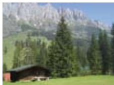
Blick vom Mitterberghaus auf den Hochkönig