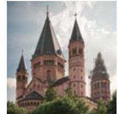
In Mainz werden beide Synoden stattfinden.

So 20.09.2015. Stuttgart, 09:22 Uhr ab Stuttgart/Hbf, 12:00 Uhr Treffpunkt in Bebenhausen