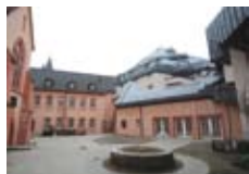
Tagungsort der 61. Bistumssynode: Der Erbacher Hof in Mainz