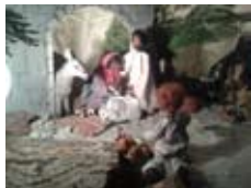
Krippe der alt-katholischen Katharinenkirche Stuttgart