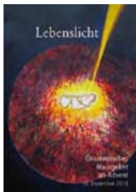
Mo 10.12.2018 Um 19:30 Uhr lädt Glockengeläut zum Hausgebet ein. Textblätter liegen in der Kirche aus.

»Lebenslicht«, unter dieser Überschrift findet am Montag, 10. Dezember, überall in Baden-Württemberg das traditionelle ökumenische Hausgebet im Advent statt. Die Arbeitsgemeinschaft christlicher Kirchen (ACK) hat zur Vorbereitung eine Arbeitsgruppe aus Benningen, Reutlingen und Rottenburg beauftragt. In der Einladung heißt es: »Haben Sie Mut, Ihre Nachbarn, Freunde und Bekannte – oder auch Ihnen weniger vertraute, noch fremde Personen – einzuladen, um gemeinsam zu feiern! Ein adventlich geschmückter Raum und die Bereitschaft einer Person, das Hausgebet zu leiten, sind gute Voraussetzungen für ein gelingendes Zusammensein.«