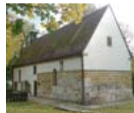
Gottesdienstort Aalen: Die St.-Johanneskirche

Gottesdienste in Aalen immer am 2. Sonntag des Monats oder an den zweiten Feiertagen um 10:00 Uhr.