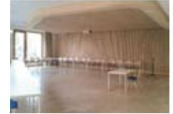
Reichlich Platz: Der neue Gemeindesaal in Karlsruhe

»Überbrückt« ist das diesjährige Dekanatswochenende in Altleiningen überschrieben. Dazu heißt es in der Einladung der Gemeinde Karlsruhe, die 2019 für die Gestaltung verantwortlich ist: »Wir vom Karlsruher Vorbereitungsteam laden Euch ein zu entdecken, was beim Über-Brücken so alles geschehen kann: Sicherheit gewinnen? Aufladen? Stabilität? Oder Grenzen überschreiten? Was Neues entdecken? Abenteuer? Oder aufeinander zugehen? In Verbindung kommen? Gemeinsam Brücken bauen?« Das beliebte Wochenende findet vom 24. bis 26. Mai statt. Anmeldeschluss ist am 15. März.