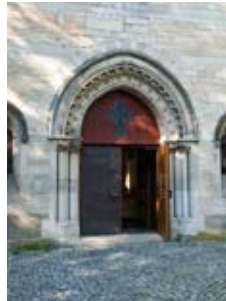
Immer am letzten Sonntag des Monats steht um 17:17 Uhr unsere Kirche St. Katharina offen für Menschen auf der Straße und für Einsame.

Am Sonntag, 31. März, ist es wieder soweit: Nach dreimonatiger Pause findet um 17:17 Uhr zunächst in unserer Kirche St. Katharina und dann im Ökumenesaal wieder Kathy's Vesper statt. Bis November wird es an jedem letzten Sonntag im Monat so sein.