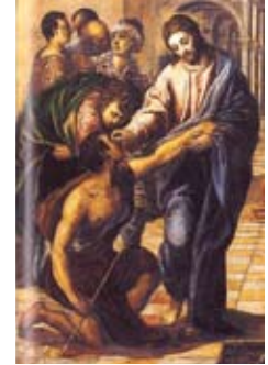
El Greco, Die Heilung des Blinden (um 1568/70, Detail)