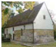
Gottesdienstort Aalen: Die St.-Johanneskirche