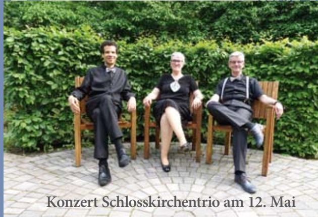
Konzert Schlosskirchentrio am 12. Mai