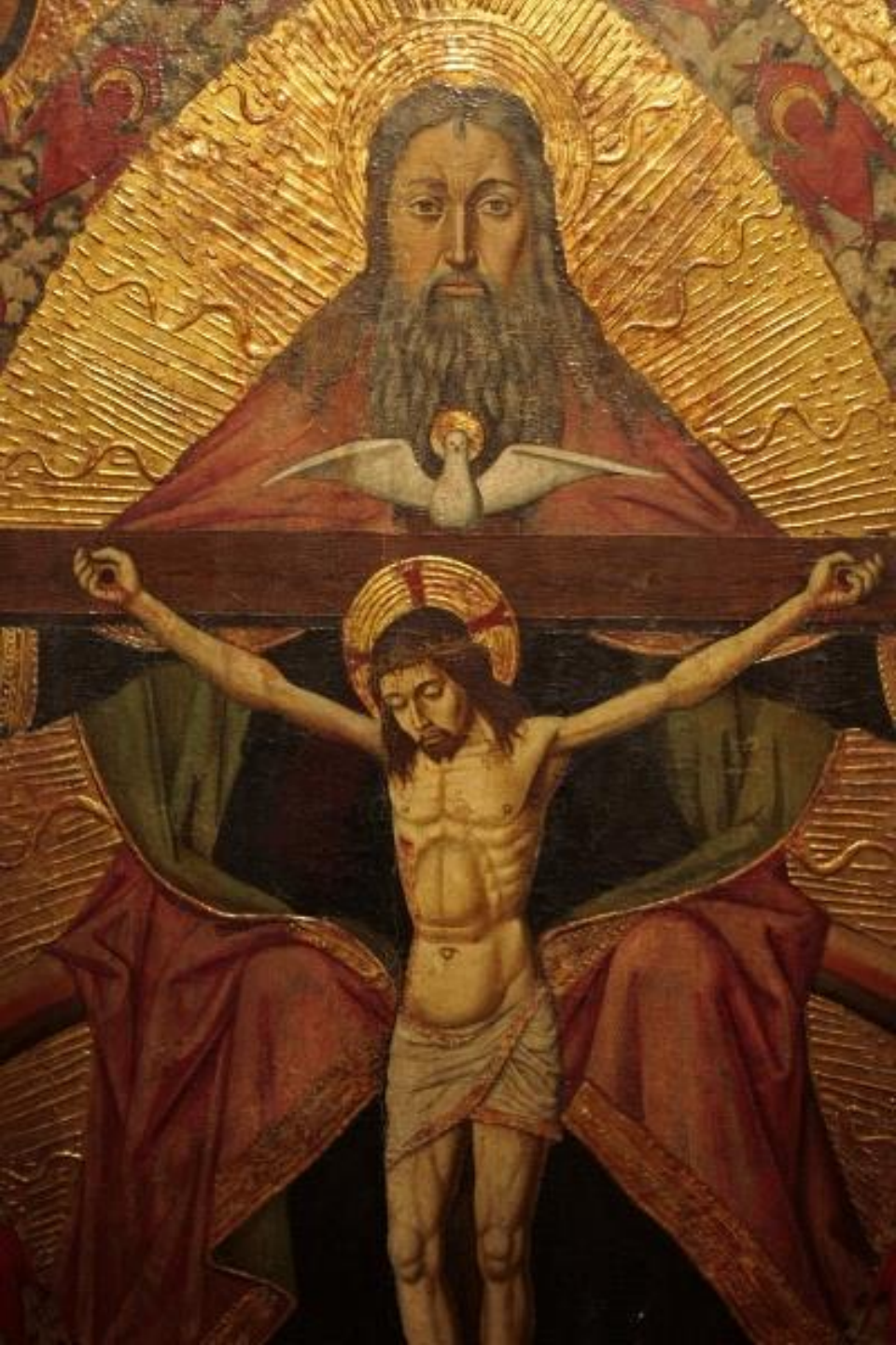
Darstellung der Dreieinigkeit in der Kirche Sant'Antonio Abate in Castelsardo auf Sardinien.